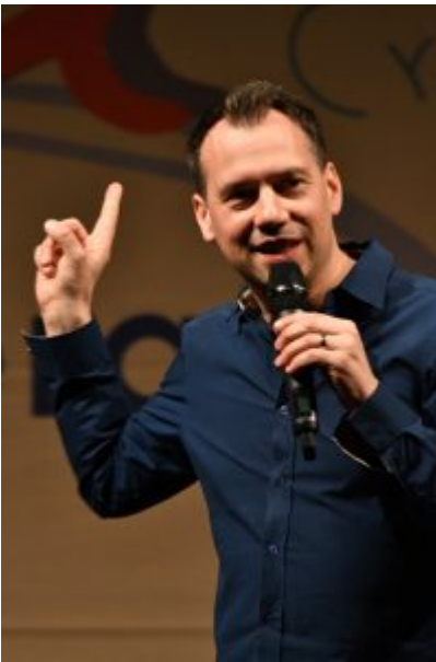
Sebastian Fitzek wurde in Wittlich wie ein Popstar empfangen.

Zwischendurch bricht er die Lesung und das beklemmende Thema immer wieder auf. Er zeigt lustige Fotos oder Filmsequenzen zum Thema Fliegen oder verliert sich in Erzählpassagen, in denen er persönliche Anekdoten, aber auch interessante Einblicke in seine Arbeit zum Besten gibt. Die Leserinnen und Leser erfahren zum Beispiel, welche Maßstäbe er an Recherche und Stichhaltigkeit anlegt, um authentisch schreiben zu können. Auf diese Weise werden die rund zwei Stunden seines Auftritts zu einem sehr kurzweiligen und ebenso spannenden wie lustigen Vergnügen.