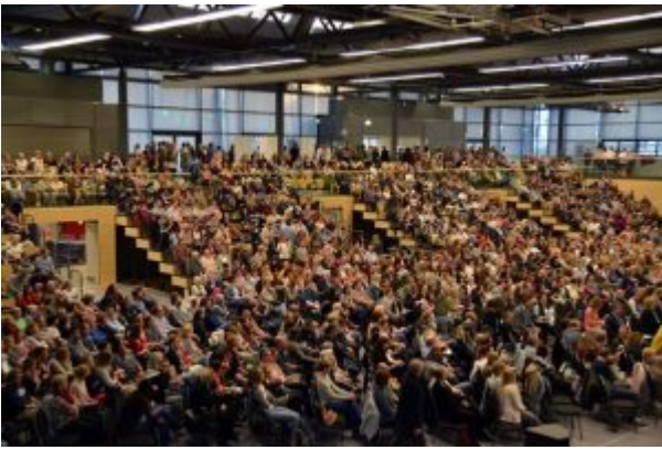
Rund 1500 Zuschauer waren beim Auftakt des Eifel Literatur Festivals dabei.

Begrüßung entgegen. Kaum zu glauben, dass so ein netter „Typ von nebenan“ Urheber von morbiden Fantasien sein kann, die einem das Blut in den Adern gefrieren lassen. Genau auf diesen Punkt geht er denn auch gleich ein, berichtet, dass die Presse sein Image enttäuschend gefunden und ihn gar als „postmodernen Harry Potter“ bezeichnet habe, bis er wenigstens von der Brille auf Kontaktlinsen umgestiegen sei. Mord und Totschlag sei aber nun mal sein Hobby: „Ihres offensichtlich auch, sonst wären Sie ja nicht hier“, sagte er und hat die Lacher auf seiner Seite.