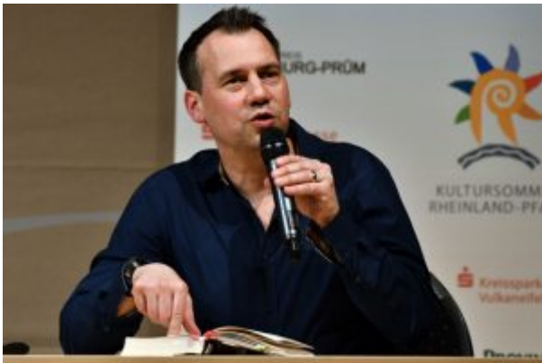
Sebastian Fitzek liest aus seinem neuen Thriller „Flugangst 7A“.

Von Anke Emmerling Zwischendurch brach der Autor die Lesung und das beklemmende Thema „Flugangst“ immer wieder auf und zeigte lustige Fotos oder Filmsequenzen zum Thema Fliegen