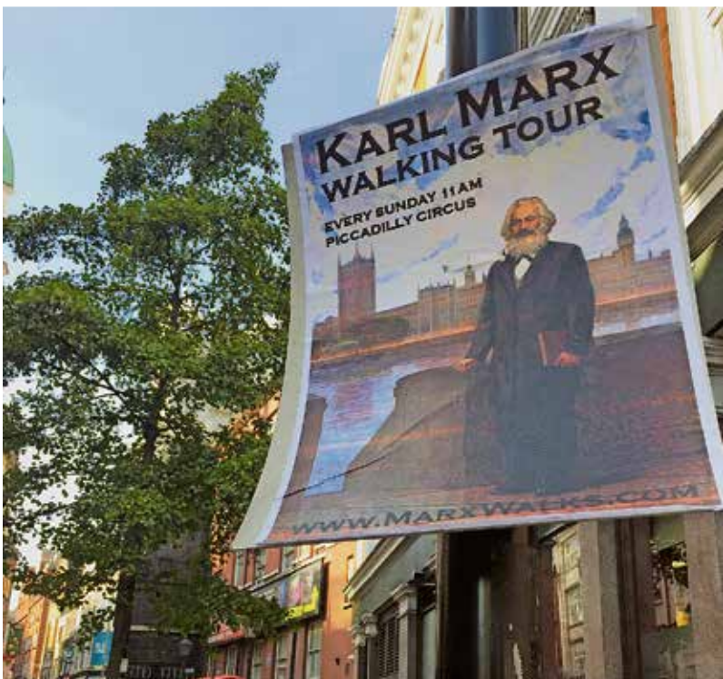
Rein zufällig entdeckt: In der Weltstadt London wird jeden Sonntag ein Karl-Marx-Rundgang angeboten.